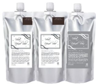
ラベル色 カラー剤…白 クリア…ライトグレー